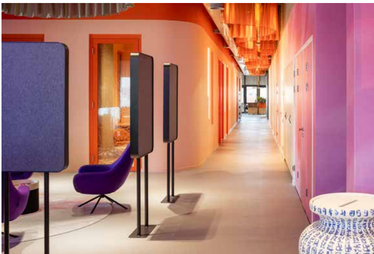
FOTO MIDDEN De entree ruimte, met op de achtergrond een van de inzingeruimtes.

Opdrachtgever Nederlandse Reisopera Interieurontwerp Hal2; Iris Hiddink, Evi Bakermans, Martijn Naus Projectmanagement Hal2; Geert Willems, Bart Waasdorp Interieurbouw RTR Interiors Afbouw Intramax Ontwerp wanden en printtapijten Happy Designs Lichtontwerp Lichtstudio Helder Productie printtapijten Donkersloot Akoestiek & cubes Deblick Losse meubelen Vepa, Inclass, Softline, Audo Copenhagen, Viccarbe Productie wandprints Vizio Gordijnen M for Curtains, Artimo, M+N Projecten Vloeren Donkersloot, Tarkett Interieurbeplanting De Klerk Oppervlakte 1300 m 2